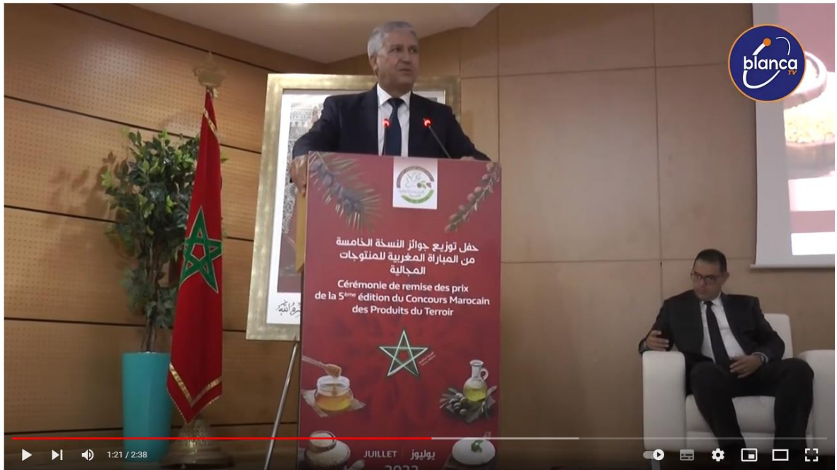
الوزير صديقي يتأسس حفل الدورة الخامسة لمباراة المنتوجات المحلية ببركان